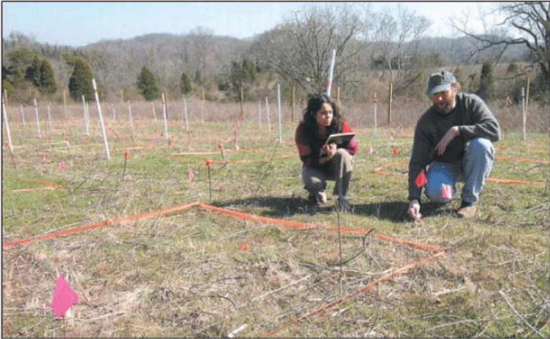
图 2. 脑力劳动的贡献在生态学中很难量化标定。由于技术工人和大学生的野外工作可能提供了重要的，非正式的第一手观察资料，而这些资料往往并不被首席研究人员认同，但实际上，这些非正式的贡献可能推动了未来的研究，指导了数据分析，促成了初稿的形成。潜在贡献者们在计划项目的前、中、后期的交流对于确保分配和承担各自的责任是至关重要的。每一个贡献者应该明确自己作为署名者的负责；责任人（或者统稿人）应该正确评估每一位署名作者，同时维护内在的一致标准。

别重要(Klein, Moser-Veillon 1999)。总而言之，项目参加者之间的坦诚交流，对决定合作者能相互理解的署名顺序卓有成效。